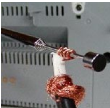
▲アンテナ端子がないラジオの場合

同軸ケーブルの芯線だけをラジオのロッドアンテナに巻き付けて固定すれば受信できます。